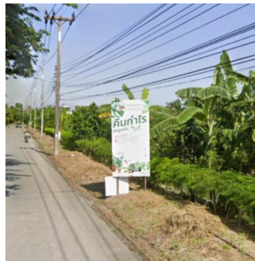
ถนนพุทธมณฑลสาย 7 - วัดทรงคนอง หมู่ที่ 4 วันที่ 18 สิงหาคม 2565