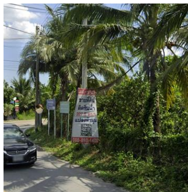
ซอยทรงคนอง 4 หมู่ที่ 2 วันที่ 18 สิงหาคม 2565